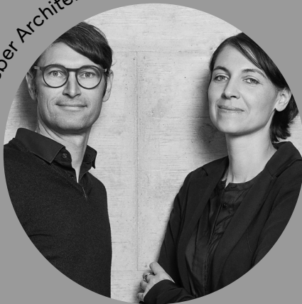
Berktold Weber Architekten

»Architektur entwickelt sich stets aus dem Kontext. Wir streben neben den räumlichen Anforderungen einen über den Zweck hinausgehenden atmosphärischen Mehrwert an.«